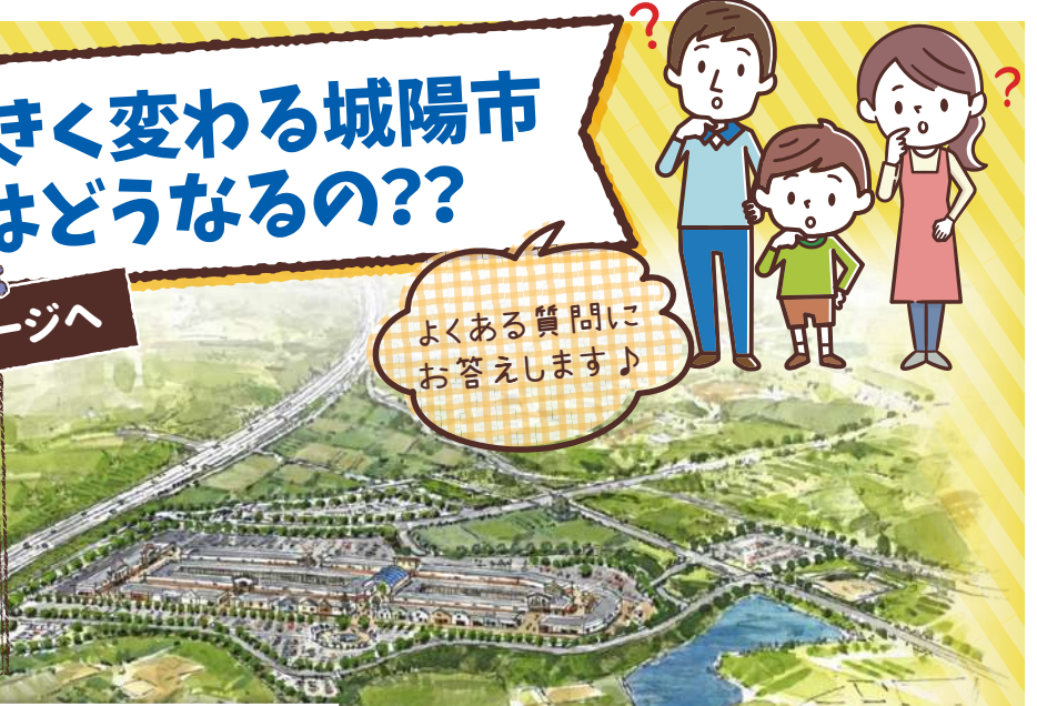
三菱地所ホームページより